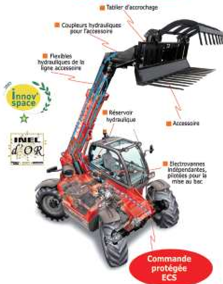
Schéma de fonctionnement